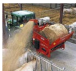
Kvæg nr. 16