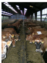
Kvæg nr. 39

Brugervenligheden i dagligdagen var meget tilfredsstillende om end anlæggene var svære at programmere. Det er dog meget vigtigt at overveje foderlogistikken inden man investerer, for automatisk fodring er ikke nødvendigvis den bedste løsning i forhold til en mobil fuldfoderblender.